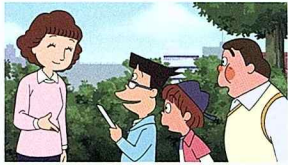
「ズッコケ三人組」シリーズ(ポプラ社刊) ©那須正幹・前川かずお・高橋信也・ポプラ社

一つの技術や文化を奥深く描く世界観や、バラエティに富んだ表現方法、作者の思いを集約した映像、一瞬のインパクトなど、短編映画だからこそ味わうことのできる世界があります。一般の映画館ではなかなか鑑賞できる機会がありませんので、ぜひこの機会にご覧ください。